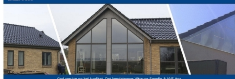
God service og høj kvalitet. Det kendetegner Vittrup's Smedie & VVS ApS.