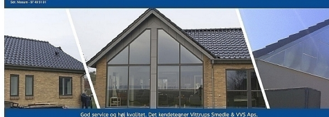
God service og høj kvalitet. Det kendetegner Vittrups Smedie & VVS ApS.

Eller skriv en mail til jo@klitferie.com og hør om mulighederne for udlejning af dit feriehus.