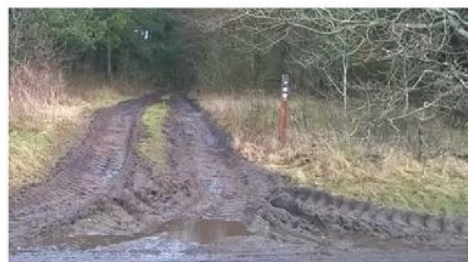
Høstruphus-skov, ved Staby, er også en der skal have forbedret sin skovvej i den kommende tid.

Det ser desværre ikke så godt ud lige nu, men vi garanterer at der inden Påske 2016, igen er gode stier at gå på i skoven!