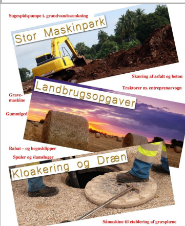
Sugespidspumpe t. grundvandsrenkning