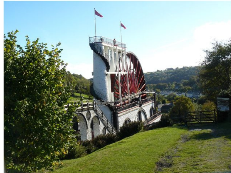
Verdens største vandmølle på Isle of Man.

Vandring i Nordengland og Isle of Man Billeder og fortælling af Vagn Andersen i Den Grønne Cafe onsdag d. 20. januar kl. 19.00