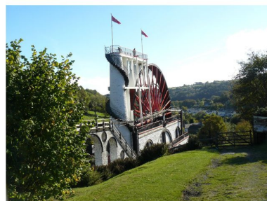
Verdens største vandmølle på Isle of Man.

Vandring i Nordengland og Isle of Man Billeder og fortælling af Vagn Andersen i Den Grønne Cafe onsdag d. 20. januar kl. 19.00